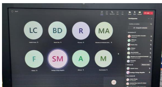
Foto 1. Vista de los participantes