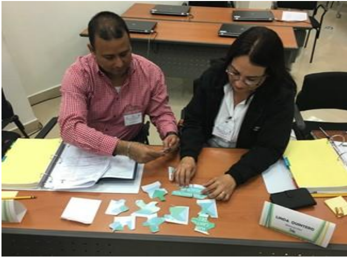
Actividades de aprendizaje.