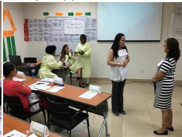
Representación de los contenidos de aprendizaje