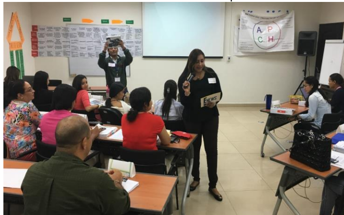
Repasando lo aprendido