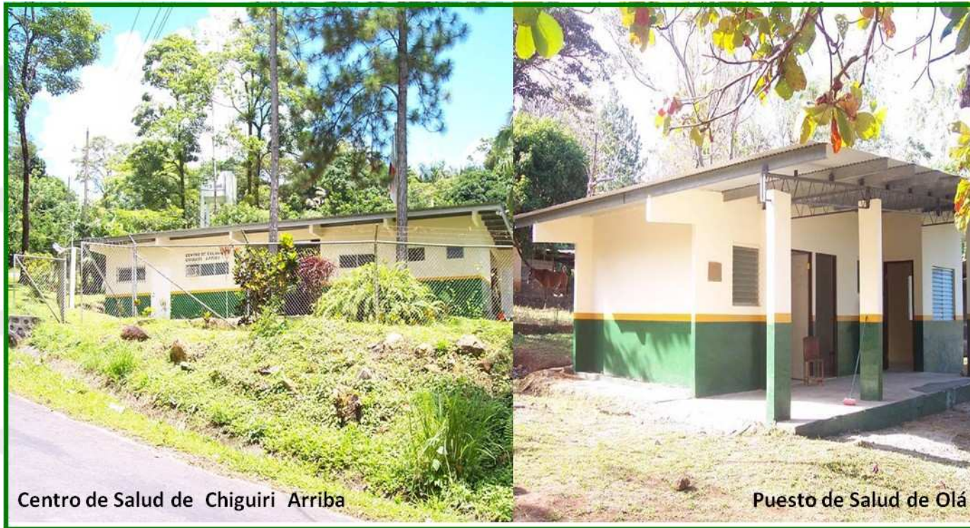
Centro de Salud de Chiguirí Arriba