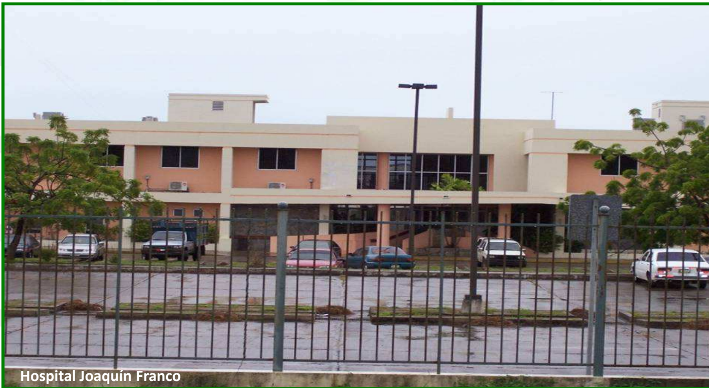
Hospital Joaquín Franco