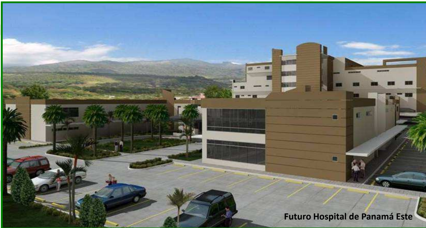
Futuro Hospital de Panamá Este