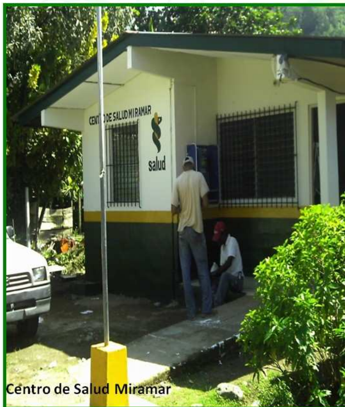
Centro de Salud Miramar