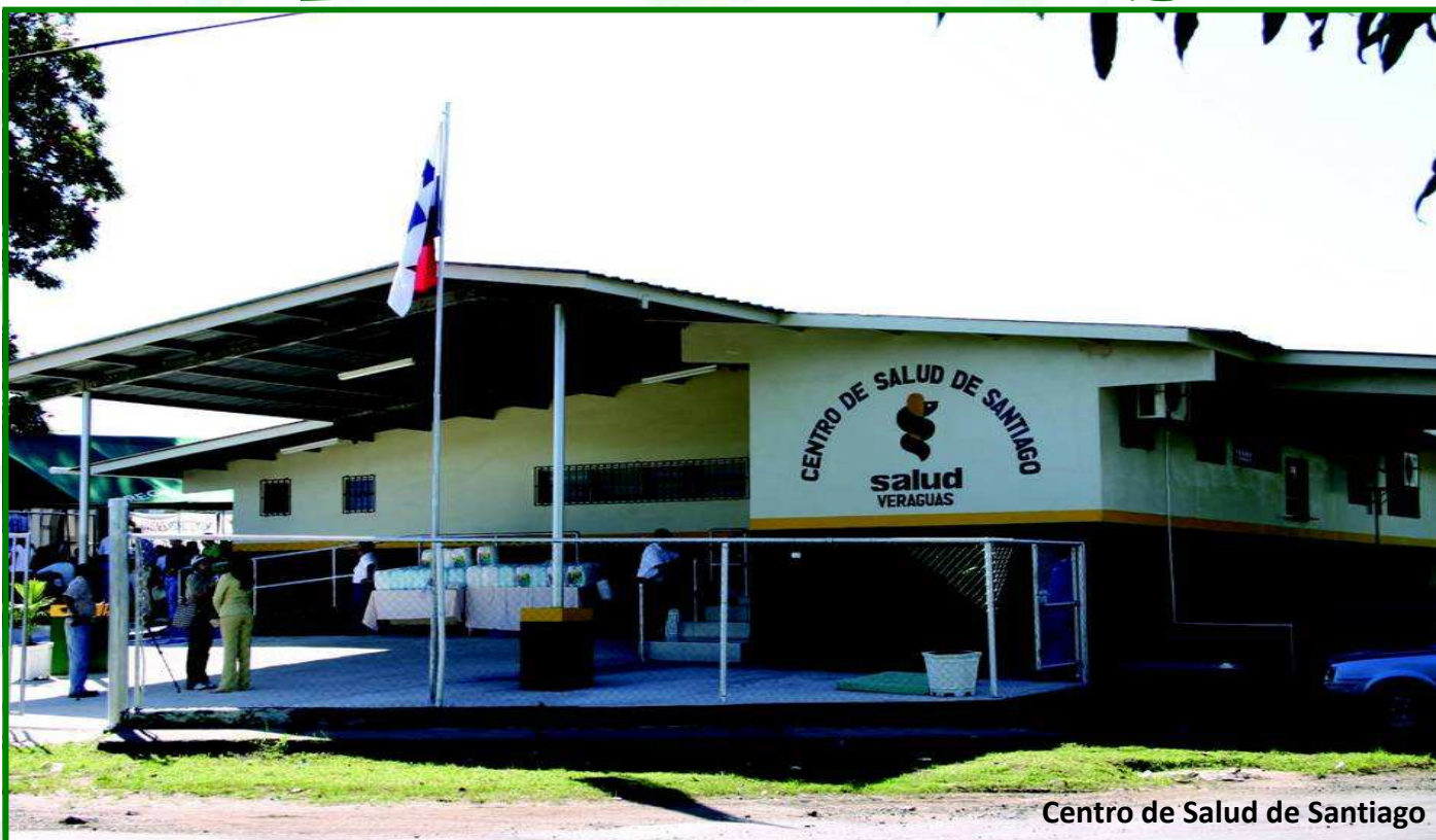
Centro de Salud de Santiago