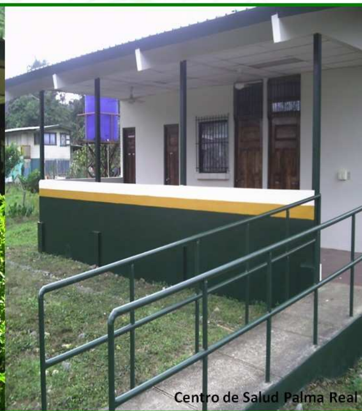
Centro de Salud Palma Real