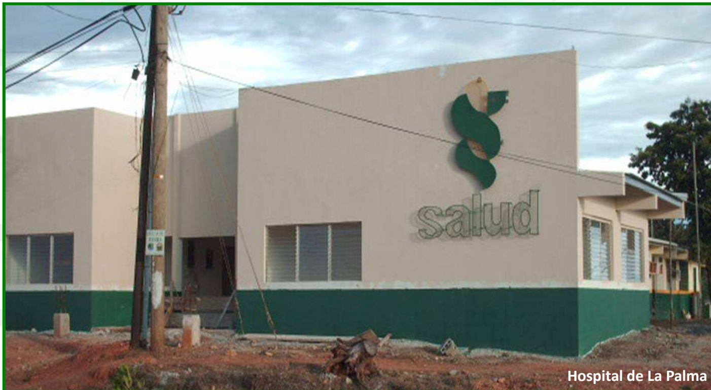
Hospital de La Palma