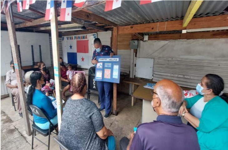
Sesión educativa realizada en la Casa Nicolás Pacheco en San Felipe. 17 de noviembre de 2022