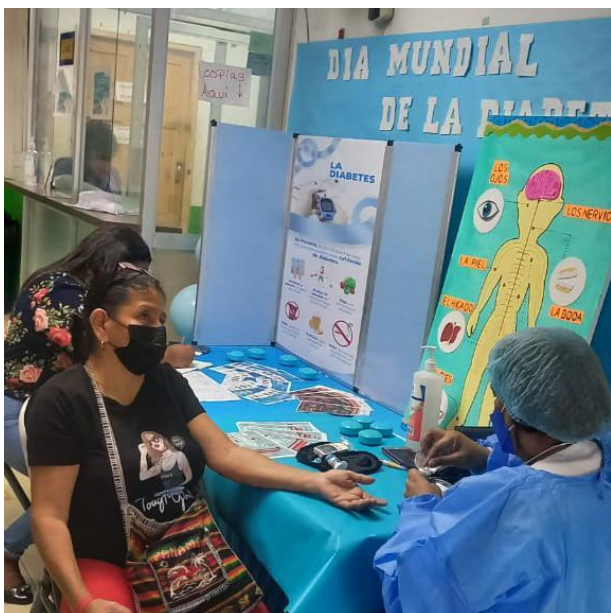
Pruebas de glicemia realizadas en el Centro de Salud de Tocumen. 17 de noviembre de 2022