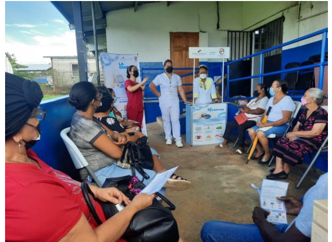
Sesión educativa realizada en el Centro de Salud de Felipillo. 16 de noviembre de 2022