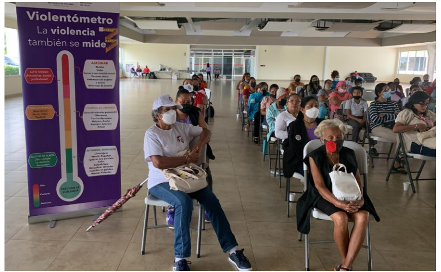
Jornada de capacitación. Complejo del Súper 99 en Mañanitas. 25 de noviembre de 2022