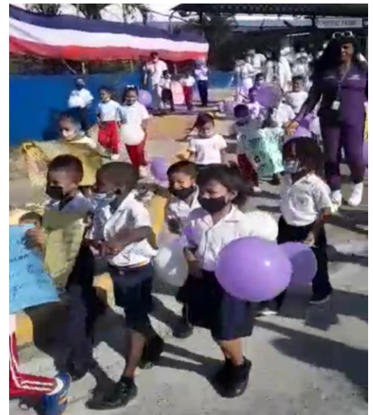
Desfile realizado por alumnos de la Escuela Fe y Alegría. 25 de noviembre de 2022