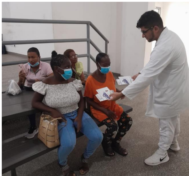
Volanteo realizado en la comunidad de Curundú. 25 de noviembre de 2022