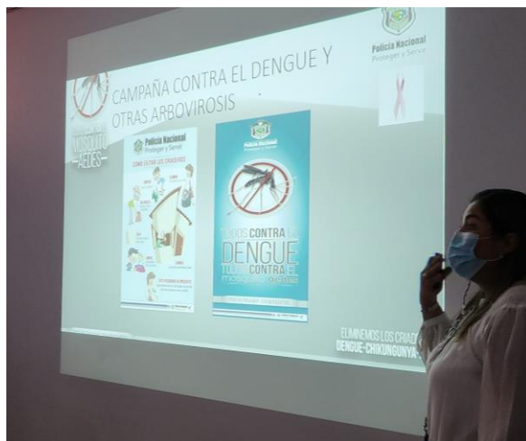
Presentación de la Policía Nacional