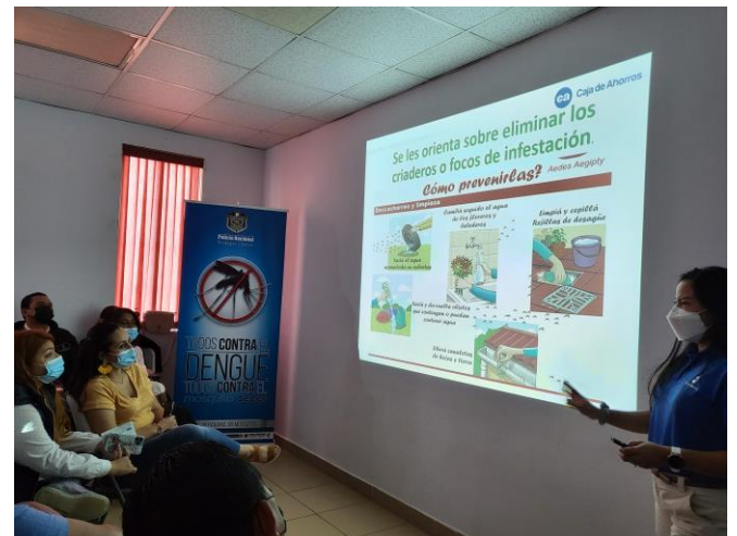
Presentación de la Caja de Ahorros