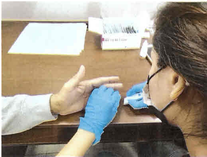
Toma de muestra para pruebas rápidas de VIH