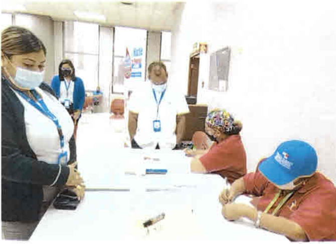
Llenado del formulario de solicitud de prueba serológica de VIH.