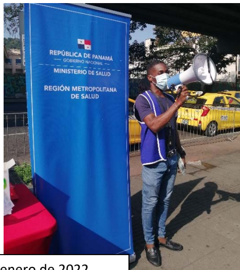
Estación del Metro 5 de mayo. 21 de enero de 2022.