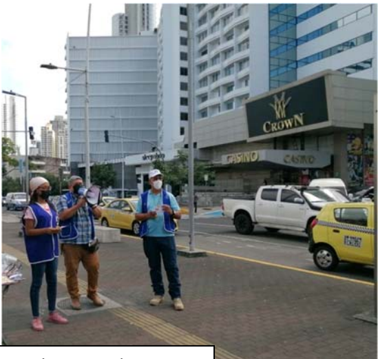
Estación del Metro Iglesia del Carmen. 24 de enero de 2022.