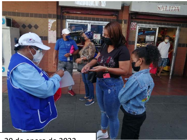
Parada de Bus El Balboa. 20 de enero de 2022.