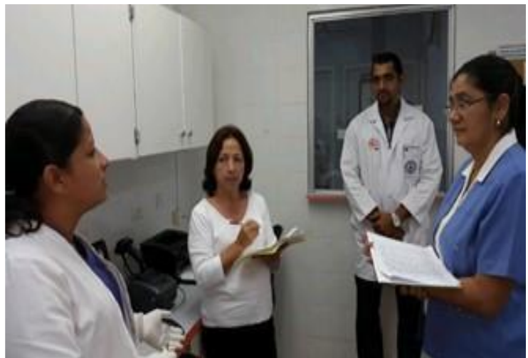
Supervisión de instalaciones sanitarias de Banco de Sangre