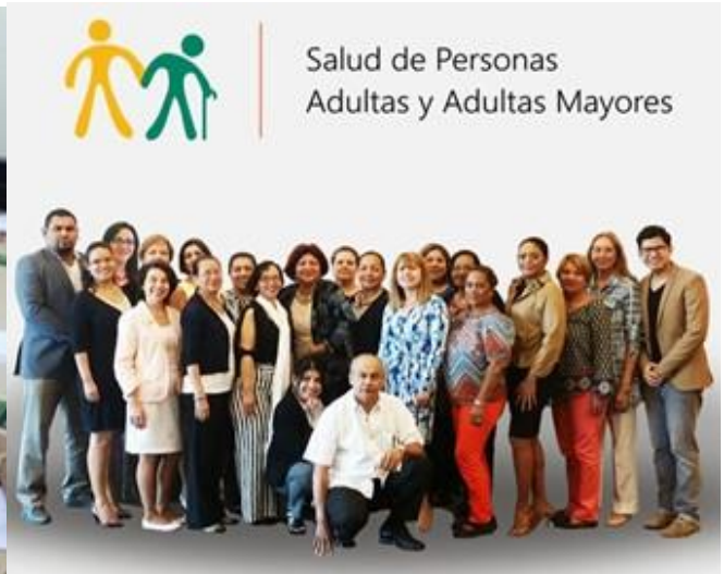
Actualización de la Norma de Adulto y Adulto Mayor y de la Historia Clínica con un enfoque mayor en la prevención, detección oportuna del riesgo y atención diferenciada del adulto mayor.