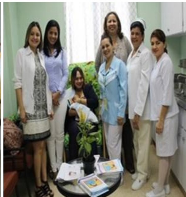
Instalación y funcionamiento de 8 lactarios institucionales.