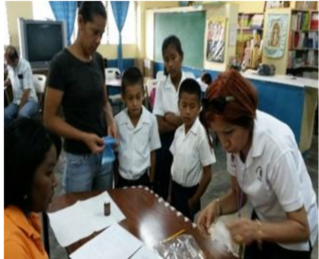
Monitoreos a nivel de escolares en 29 distritos centinelas manteniéndose los logros obtenidos y se continúa con la sostenibilidad que asegura que la sal de mesa producida en nuestro país está debidamente yodada