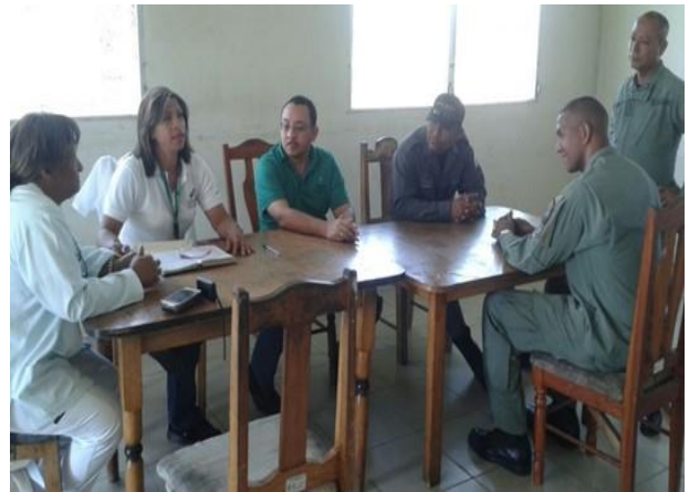
Supervisión de clínicas e instalaciones penitenciarias