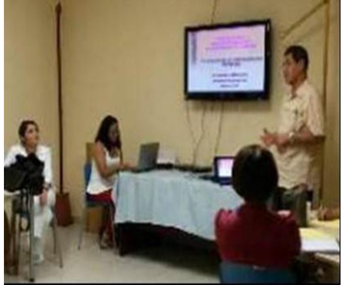
Talleres de capacitación en el nuevo algoritmo de realización de la prueba de VIH