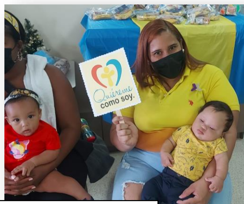
Agasajo realizado a pacientes y acudientes que acuden al Policentro de Salud de Juan Díaz