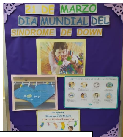
Murales confeccionados por el Centro de Salud de Pueblo Nuevo y el Centro de Salud de Veracruz.