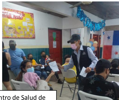
Sesión educativa realizada en el Centro de Salud de Veracruz y Pueblo Nuevo.