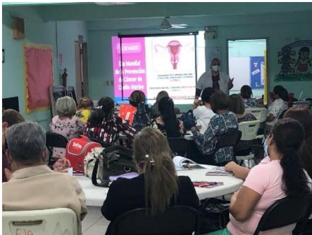
Sesión educativa realizada en el Salón de reuniones de la Escuela Justo Arosemena. 28 de marzo de 2022