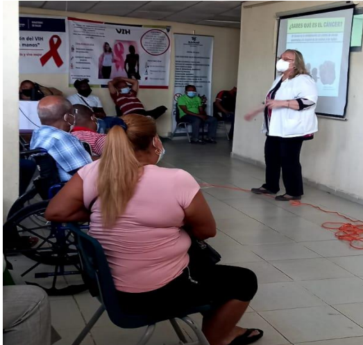
Sesión educativa realizada en el Centro de Salud de Curundú. 25 de marzo de 2022