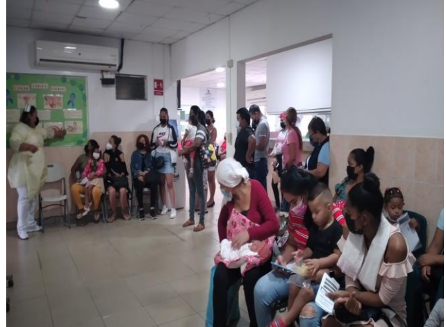
Sesión educativa realizada en el Centro de Salud de Felipillo. 28 de marzo de 2022