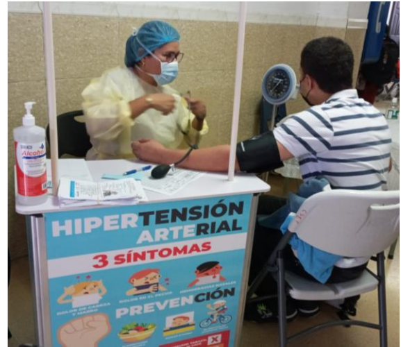
Sesión educativa y toma de presión arterial en el Centro de Salud Emiliano Ponce