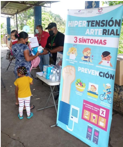
Sesión educativa en la comunidad de Rana de Oro en Pedregal.