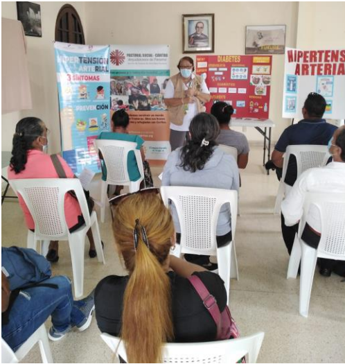
Sesión educativa. Hogar Luisa en Parque Lefevre.