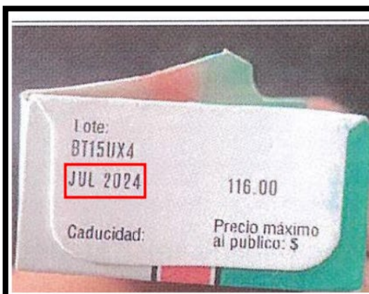
Imagen del producto falsificado.

La alerta se deriva a partir del análisis técnico y evaluación de la información proporcionada por la empresa BAYER DE MÉXICO, S.A DE C.V. , titular del registro sanitario, el cual identificó la falsificación del producto ASPIRINA PROTECT® 100 mg (ácido acetil salicílico), presentación de 28 tabletas, con número de lote BT15UX4 y con fecha de caducidad julio de 2024 .