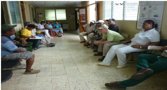
Reunión de equipo