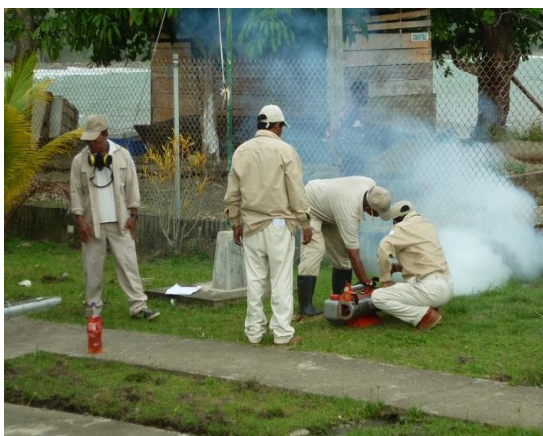
Equipo de control de vectores contra en mosquito adulto