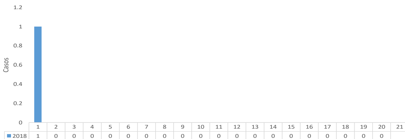
Número de casos confirmados de Zika según semana epidemiológica en la República de Panamá, año 2018 (sem 1)