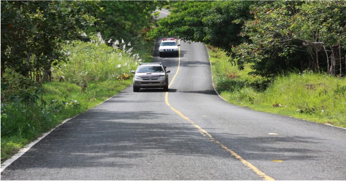
carretera hacia Icacal