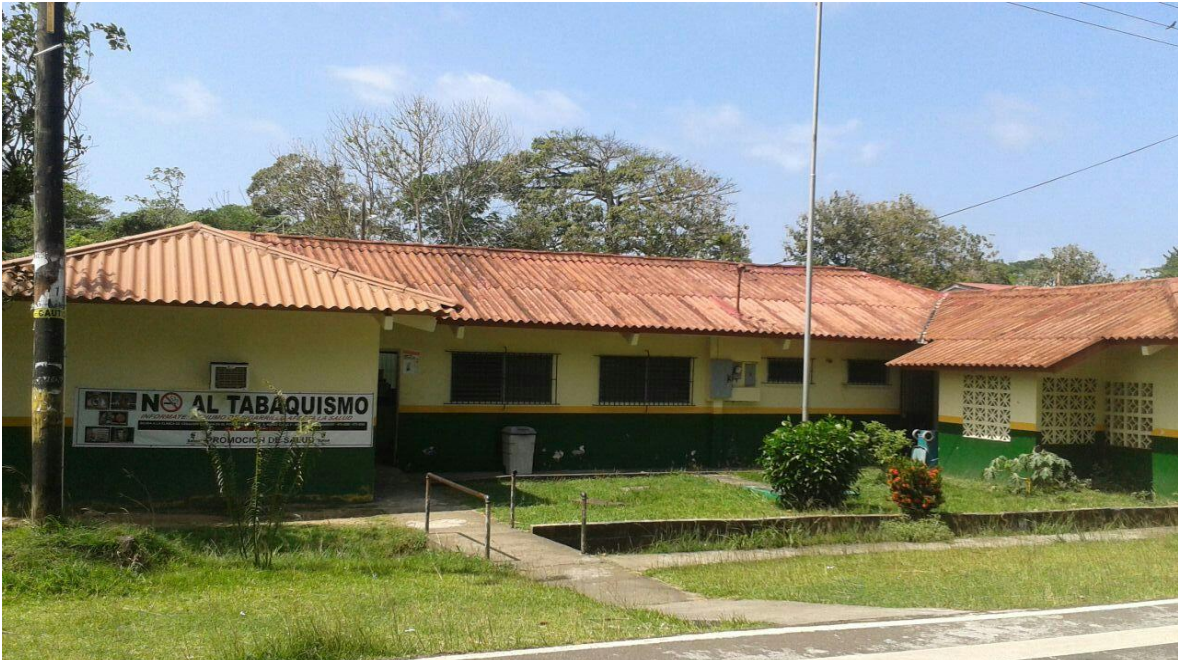
Centro de Salud de Icacal