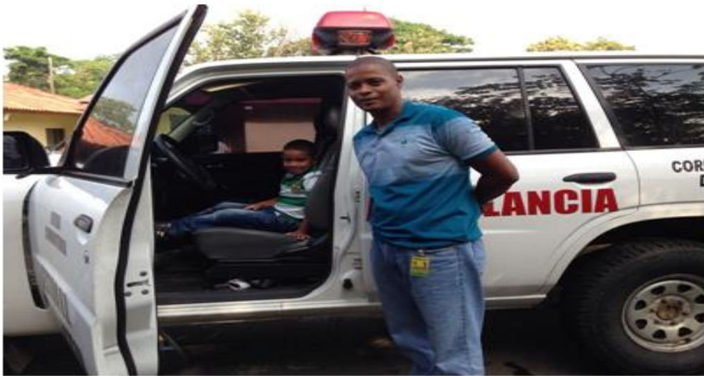
Ambulancia del Centro de Salud Palmas Bellas