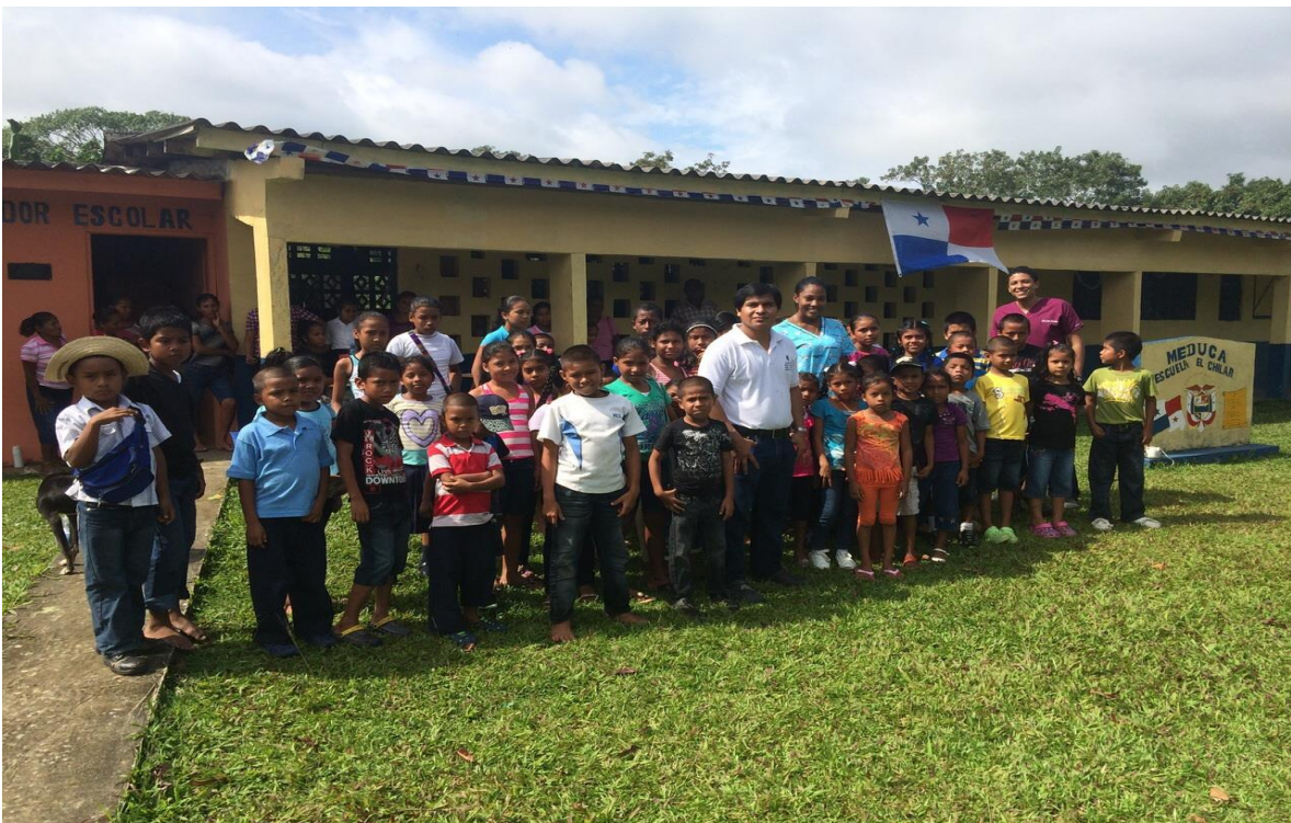
Gira programa Escolar