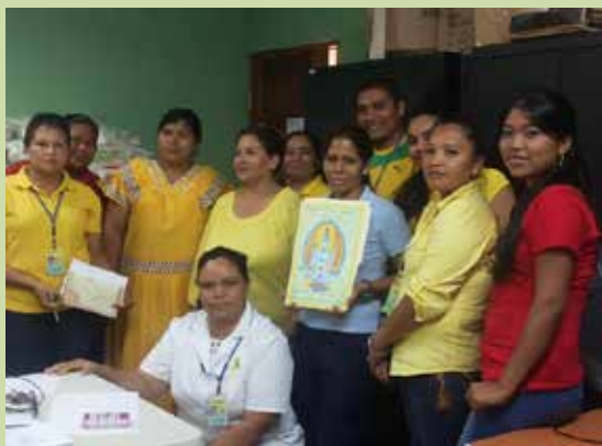
Concursantes y parte del equipo de trabajo durante la actividad del MINSA de la Campaña de Salud Mental, donde se pudo apreciar la creatividad en cada uno de los trabajos.

Destacando también, que es importante que la familia se integre en la recuperación de estos pacientes, así como se debe evitar la discriminación de las personas que padecen de salud mental.