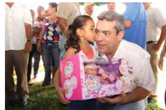
El Vice Ministro de Salud, Dr. Miguel Mayo haciendo entrega de regalos a los niños del área de Parita.

De esta manera los habitantes gozaron de servicios de salud como: toma de presión arterial, vacunación, examen de Papanicolaou y mamas, curaciones, inyectables, distribución de medicamentos gratuitos, atención integral, control, prevención-educación en salud, promoción, charlas de higiene bucal, odontología, entrega de kit de cepillos, desparasitación canina, nebulización e inspección a viviendas por los equipos de salud pública, y varias actividades más.