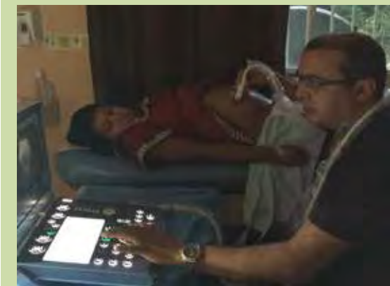
Momentos en que estaba siendo probado la máquina de ultrasonido en 3D y 4D totalmente nueva que fue adquirida gracias a la donación de la Fundación Jennifer López.

Este moderno equipo en tercera dimensión, puede captar imagen fija y se utilizará solo para el casos donde el médico sospeche de malformaciones como paladar hendido y labio leporino; mientras que 4D (cuarta dimensión) es para ver el movimiento y posición anormal.