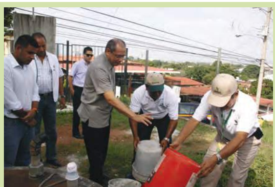
Operativo de limpieza y fumigación contra el dengue en el área de Juan Díaz junto al Ministro de Salud y parte de su equipo de trabajo.