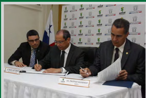
Convenio con todos los medios de comunicación para el abordaje del tema de Ébola.