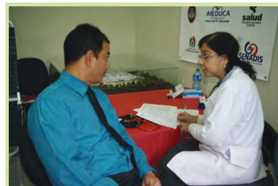
Entrevista con donante de sangre para tomar datos generales del donante.