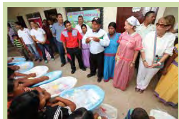
La Primera Dama de la República visitó y entregó donaciones a todos los lugareños quienes se mostraron muy contentos con las acciones que se están haciendo en pro de la comunidad.

También personal del MINSA, brindó atención en medicina general, vacunación, entrega de medicamentos, servicio de odontología y pruebas de laboratorio, con el fin de que la población conozca su condición física mediante giras de salud.