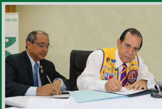
Firma del Convenio de Colaboración entre MINSAL y el Club de Leones, en temas de promoción y prevención de estilos de vida saludables y enfermedades trasmisibles por vectores.