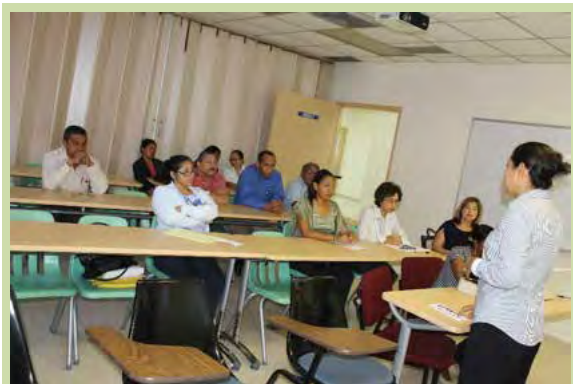
Profesionales de salud que asistieron a la Jornada de Actualización Médica.

La iniciativa permitirá a los profesionales de la salud optimizar y mejorar la atención a los miles de pacientes del área Oeste.