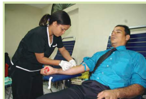
Donante momentos en que se extraían sangre, a través del Programa Nacional de Sangre.