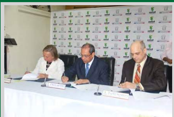
Firma del Convenio de Cooperación Educativa entre el Ministerio de Salud y el Colegio Médico.