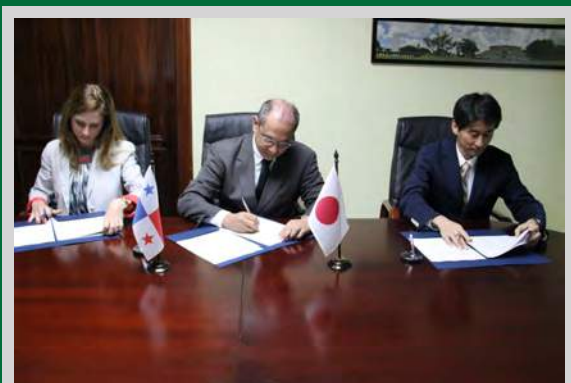
Momentos en los que el Ministro de Salud realizaba la firma del Convenio con JICA, para la preparación de profesionales panameños en alcantarillado sanitario.