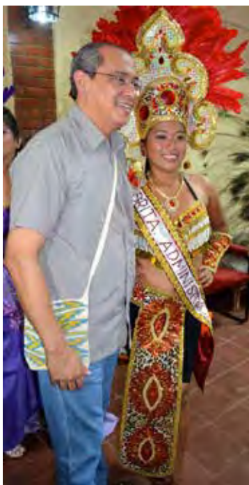
El Ministro de Salud, Francisco Javier Terrientes compartió junto con la Región de Salud de Ngäbe-Buglé de una tarde llena de actividades.

La Región de Salud Ngäbe-Buglé realiza el 1er Convivio MINSA— Ngäbe-Buglé a beneficio de la Teletón 20-30, en esta ocasión contamos con la presencia del excelentísimo Sr. Ministro de Salud Dr. Francisco Javier Terrientes. En esta actividad hubo juegos, venta de comida, Karaoke, Caravana y escogencia de nuestra Reina 2014.