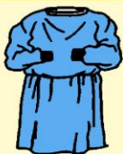
Bata impermeable de manga larga