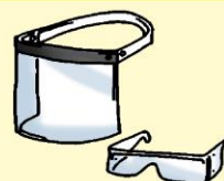
Lentes o pantalla