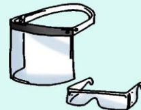
Lentes o pantalla