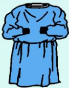
Bata impermeable de manga larga