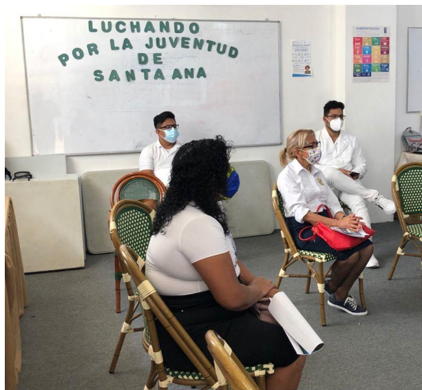
Participantes del Seminario Taller de Servicios de Salud Amigable y de Calidad. Hotel Santa Ana. 27 de agosto de 2021.