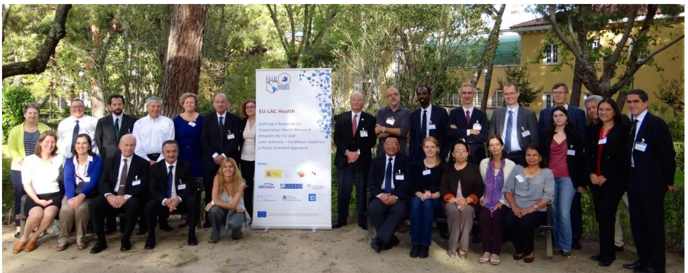
Taller de Consulta y Validación. Madrid, Octubre 2014