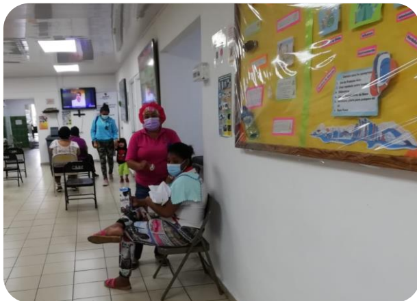
Orientación sobre lactancia materna y entrega de botones confeccionados por el Centro de Salud de Boca La Caja. 05 de agosto 2020.