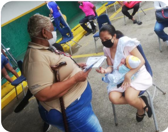
Orientación sobre lactancia materna. Centro de Salud Emiliano Ponce. 05 de agosto 2020.