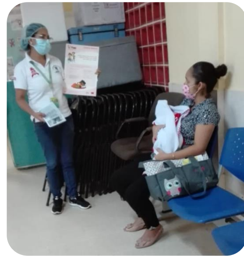
Orientación sobre lactancia materna. Centro de Salud Emiliano Ponce. 05 de agosto 2020.