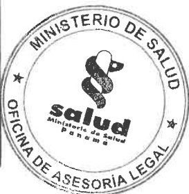
DR. LUIS FRANCISCO SUCRÈ M. Ministro de Salud