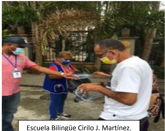
Escuela Bilingüe Cirilo J. Martínez. Pedregal. 09 de abril 2021