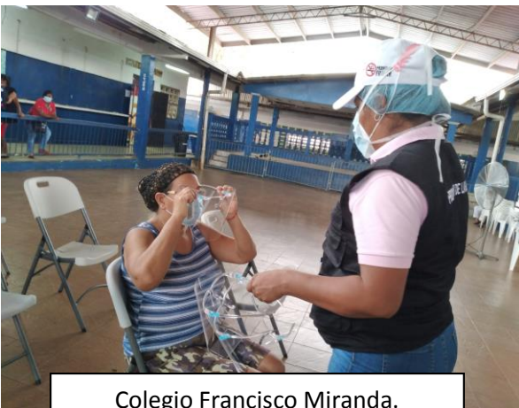
Colegio Francisco Miranda. Felipillo. 10 de abril 2021