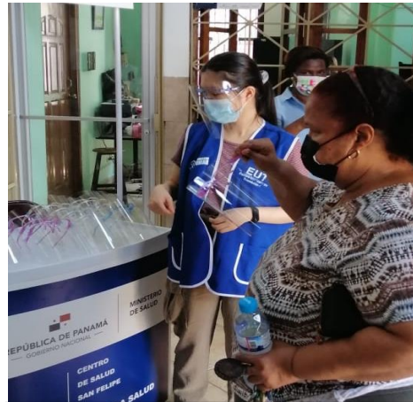
Escuela México. San Felipe. 21 de abril 2021.