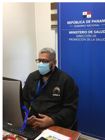
Foto 3. Vista de la Presentación y participantes de la reunión y el Moderador