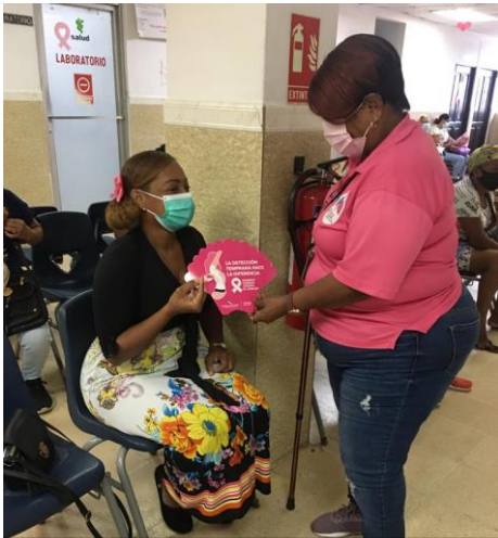
Centro de Salud Emiliano Ponce.