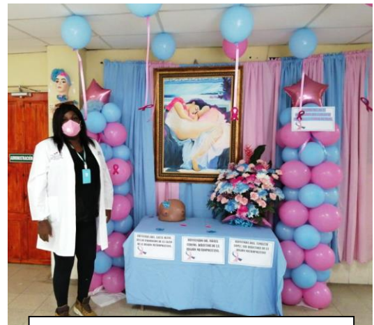
Inauguración del Mes de la Prevención del cáncer de mama en el Centro de Salud del Chorrillo. Octubre 2020.