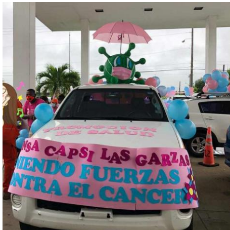
Caravana realizada por Minsa Capsi Las Garzas por inauguración del mes de la Prevención del cáncer de mamas. Octubre 2020.