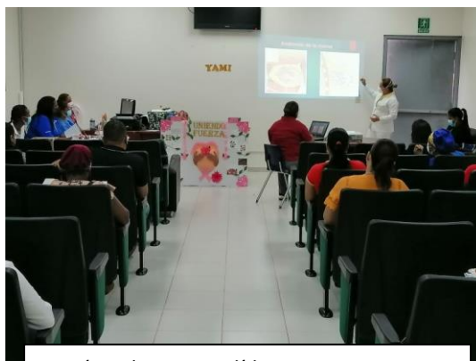
Sesión educativa a líderes comunitarios y al Grupo Colmena de Minsa Capsi Las Garzas, sobre prevención de cáncer de