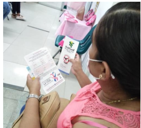
Centro de Salud de Santa Ana