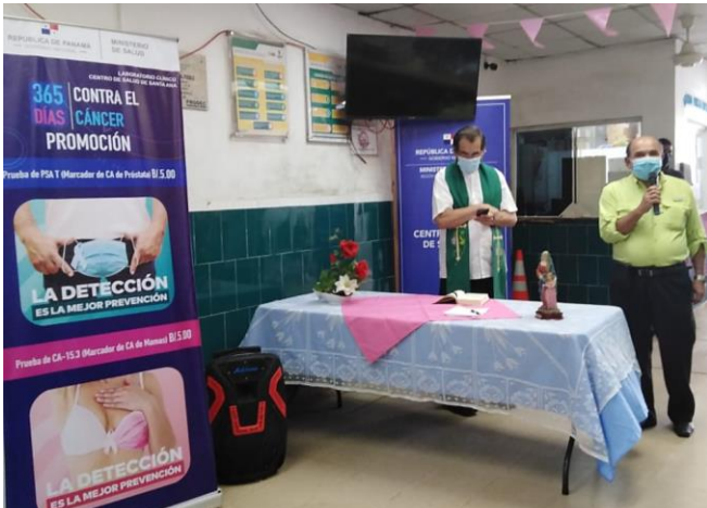
Misa por inicio del mes de la Campaña de la Cinta Rosada. Centro de Salud de Santa Ana. 05 de octubre 2020.

L.A 4.2.2 Fomento de las actividades para la divulgación de los derechos y deberes en salud a nivel del individuo, la familia y la comunidad.