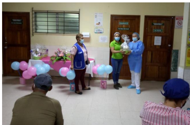
Centro de Salud 24 de diciembre