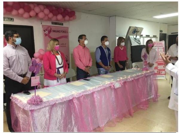
Inauguración del servicio de mamografía en el Centro de Salud Emiliano Ponce. 17 oct 2020.