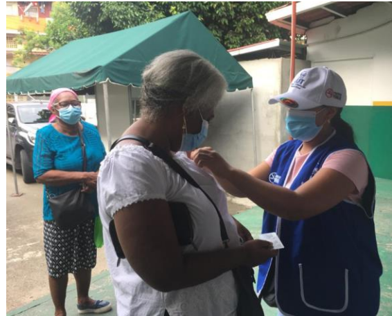
Policentro de Salud de Juan Díaz