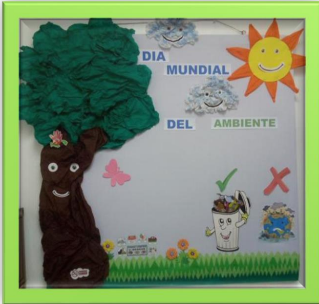
Mural del Centro de Salud de Pedregal. 05 de Junio de 2020