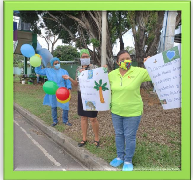
Pancartas elaboradas por el Centro de Salud de Tocumen. 05 de junio de 2020