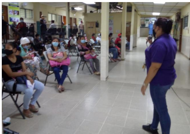
Sesión educativa en sala de espera. Centro de Salud 24 de diciembre. 25 de noviembre 2020.