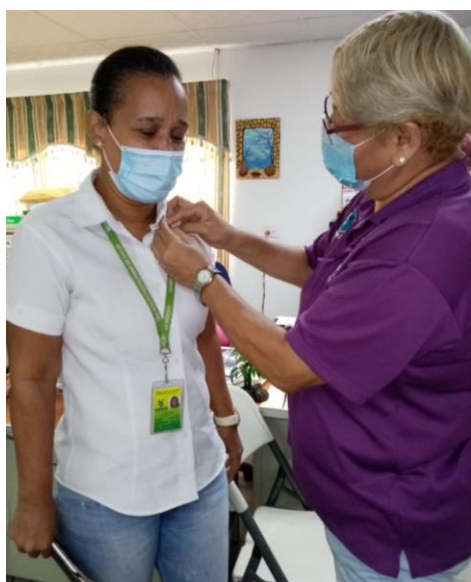
Colocación de cintas moradas a funcionarios. Centro de Salud de Tocumen. 25 de noviembre 2020.