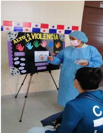
Sesión educativa en el Centro de Salud de San Felipe. 26 de noviembre 2020.