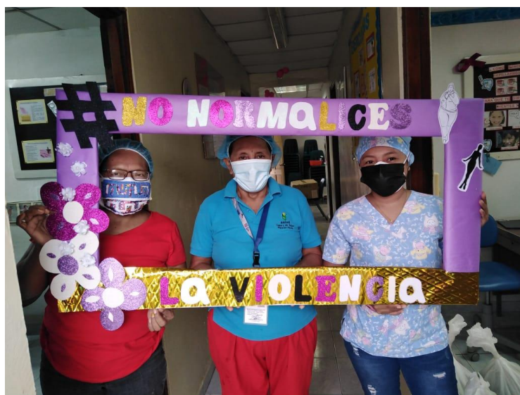
Sesión educativa realizada en el Centro de Salud de Paraíso-Ancón. 25 de noviembre 2020.