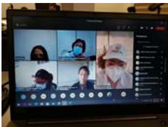
Foto 1. Vista de los participantes de la reunión