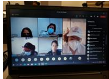
Foto 2. Vista de los participantes