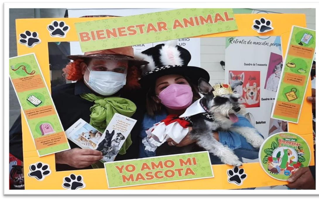
Ilustración 6: Entrega de Trípticos sobre la “Ley 70” y la “Tenencia Responsable”.