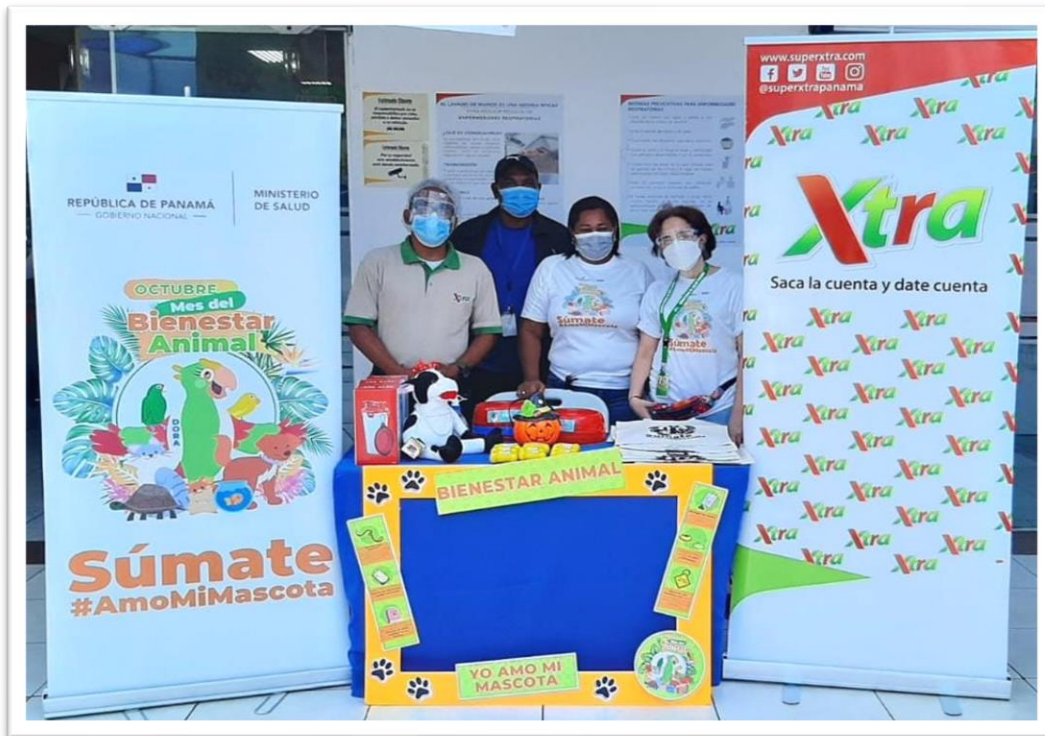
Ilustración 5: “Dora la Promotora” socializando la Ley 70 en los Supermercado Xtra de Villa Lucre y Los Pueblos (23-10-21).