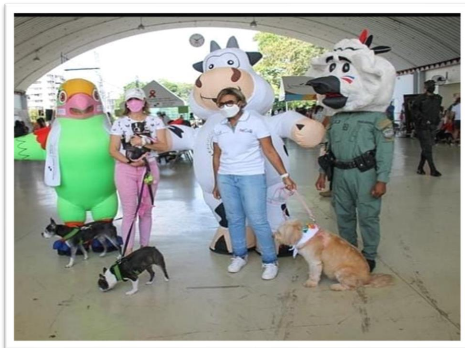
Ilustración 2: Participación de su Excelencia la Primera Dama de la República de Panamá Yasmín Colón de Cortizo y la Viceministra de Salud Dra. Ivette Berrío Aquí (3-10-21).