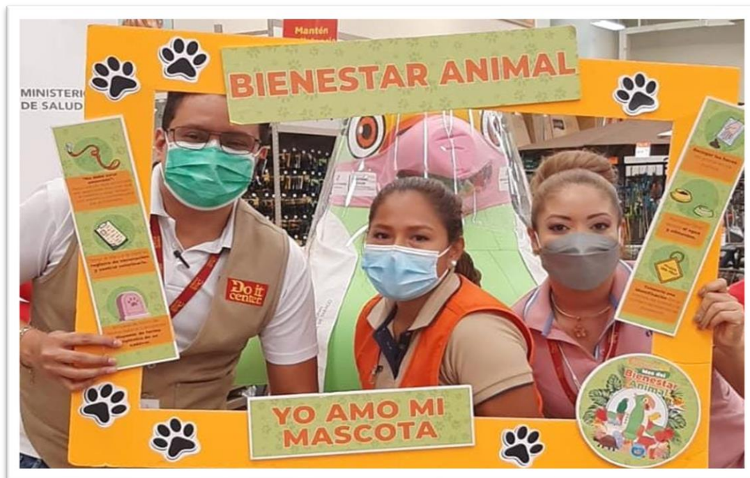
Ilustración 4: “Dora la Promotora” socializando la Ley 70 en Do it center de Los Pueblos (23-10-21).