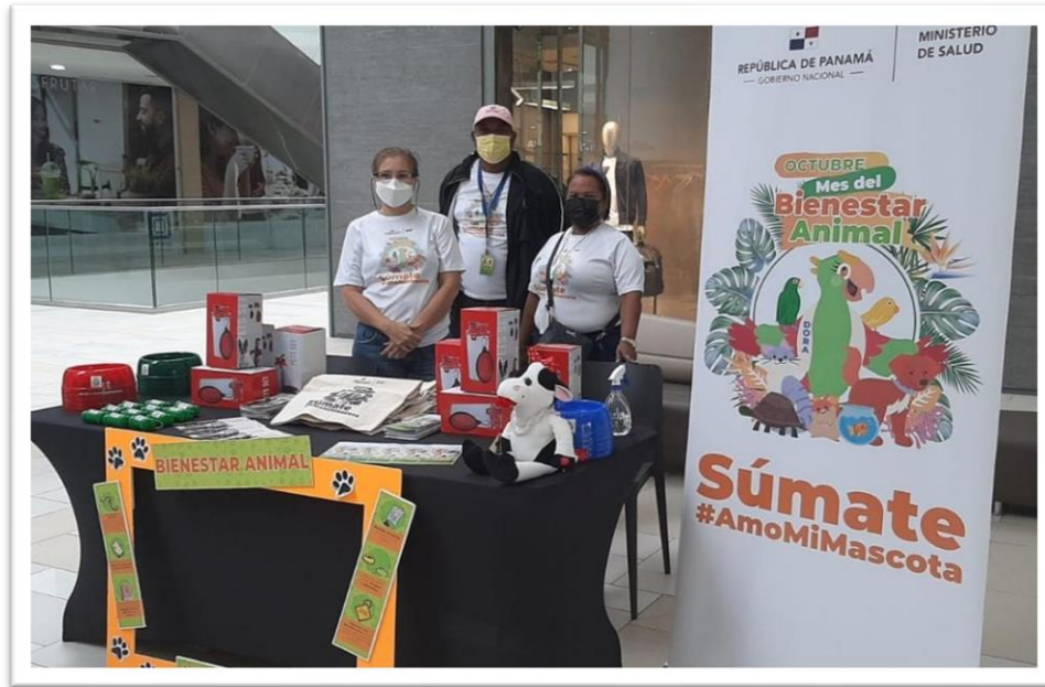
Ilustración 7: Stand de la Dirección de Promoción de la Salud en la Feria " Huellas con Estilo" en Atrio Mall (30-10-21).