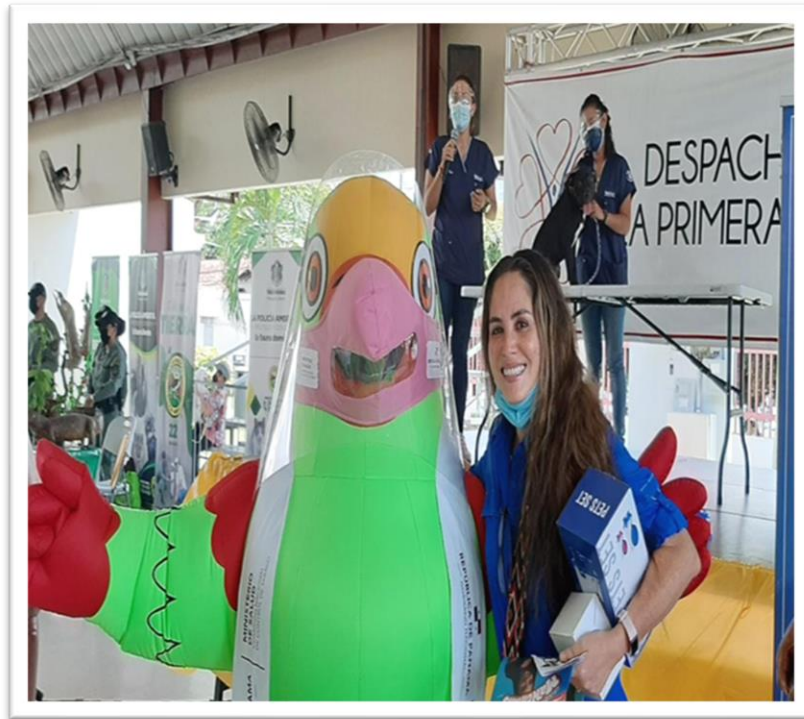
Ilustración 3: Participación de la Honorable Diputada Zulay Rodríguez en la Feria “Amo mi Mascota”.