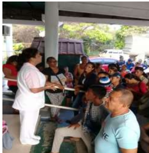
CHARLA SOBRE PREVENCIÓN DE TUBERCULOSIS