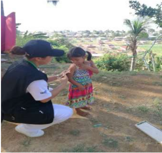
CAMPAÑA DE VACUNACIÓN EN VERACRUZ