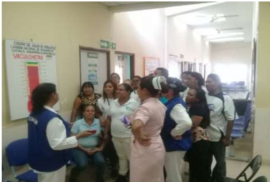
PRESENTACIÓN DE LOS LOGROS: META 100% EN EL VACUNÒMETRO