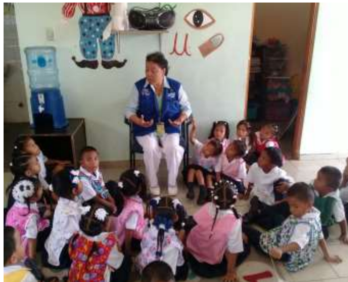
ORIENTACIÓN EN LAS ESCUELAS SOBRE IMPORTANCIA DE LAS VACUNAS