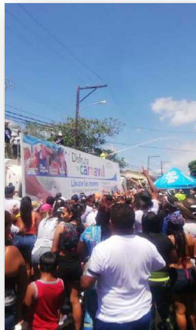
Cisterna del MINSA en culecos de Calle Abajo de Chepo-Carnavales 2020. Mensajes lavado de manos y Coronavirus a través de mensajes del D.j. de la discoteca móvil