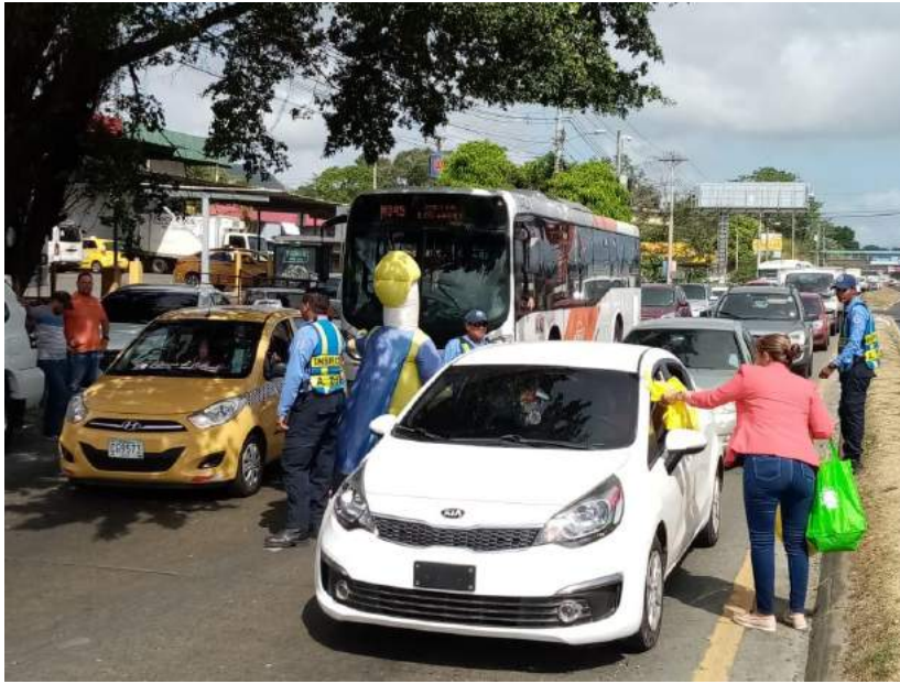
Actividad Interinstitucional realizada Verano Seguro y Saludable en Villa Zaita