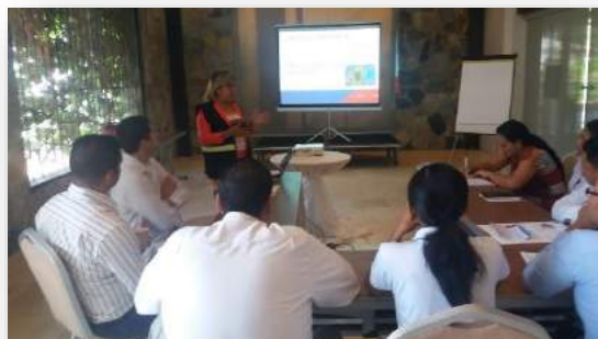
Hotel Bristol Río Hato

Nota: Adjuntar listado de participantes Encuesta de Pre test y Post test aplicada