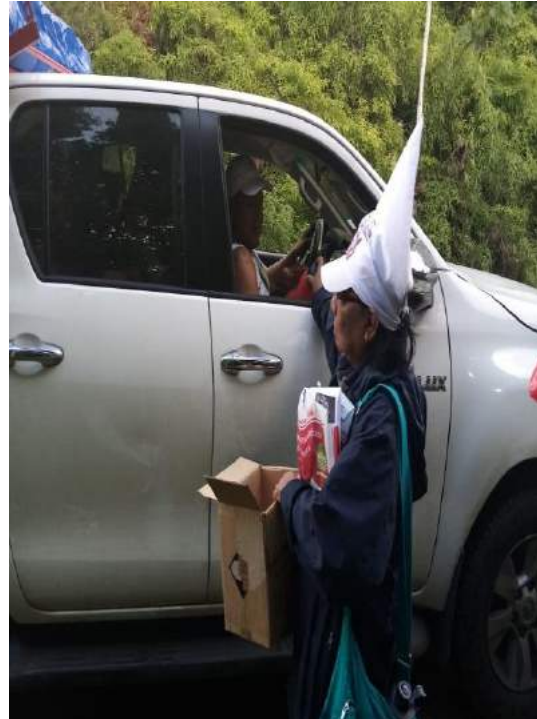
También se procedió el volanteo por la carretera Llano-Cartí, específicamente a la altura de reten Nusagandí a turistas y público en general.