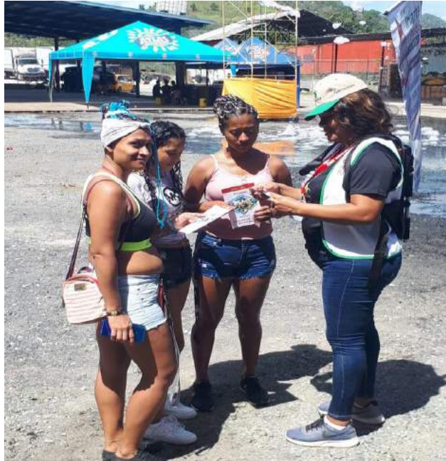
Actividades realizadas en diferentes puntos de la Región