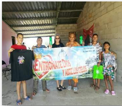
Visitas a campamentos de retiros espirituales.