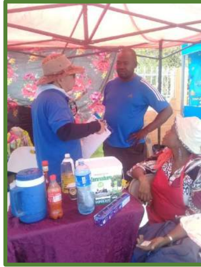
23/02/2020 Domingo de Carnaval