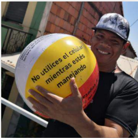
Artículos promocionales entregados