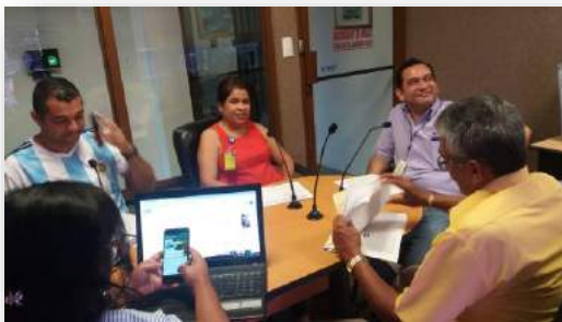
Radio Mi favorita