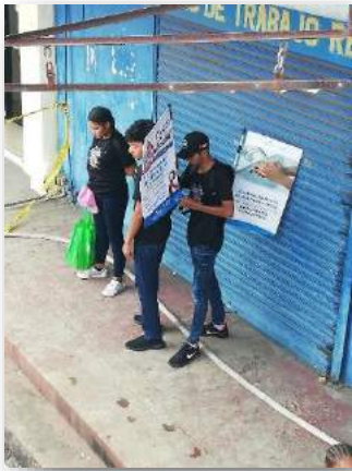
Vallas móviles con mochilas