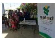
Docencia Higiene Ambiental e Interculturalidad