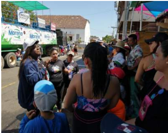
Tarima de Espectáculos