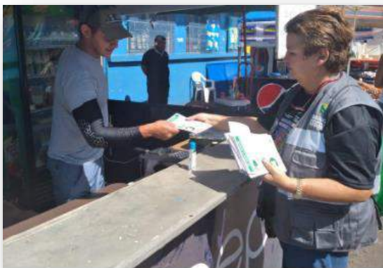
Visita a los expendios ambulantes de alimentos en los predios del carnaval.