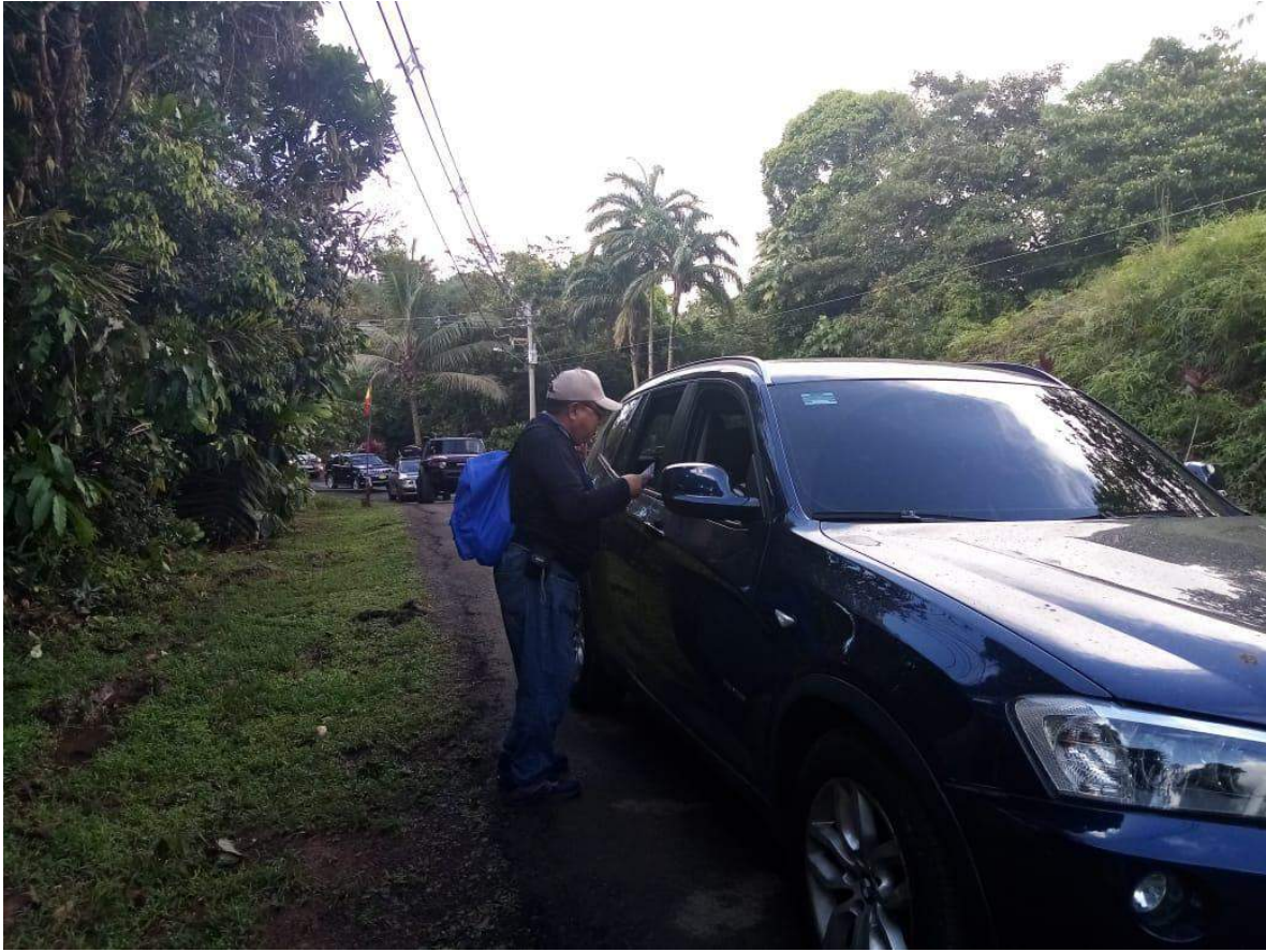
Volanteo con orientación sobre la prevención de Coronavirus en la Carretera Llano-Cartí, por personal de la Región de Salud de Kuna Yala.