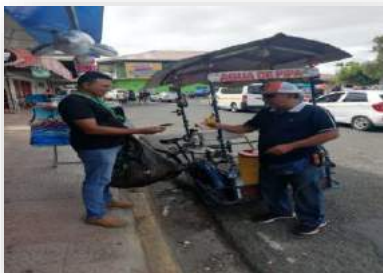
Promoción Carnavales en Las Tablas