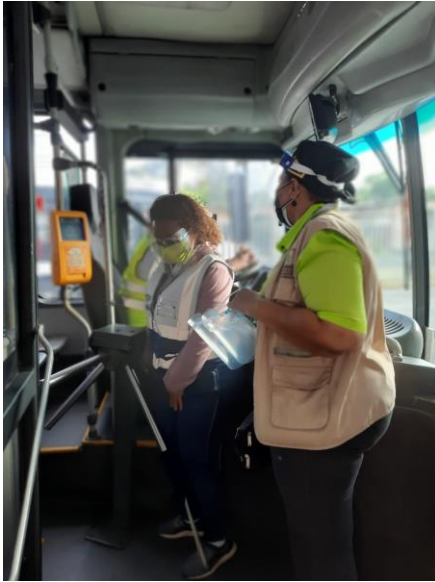
Parada de Buses en Mañanitas. 18 de mayo 2021