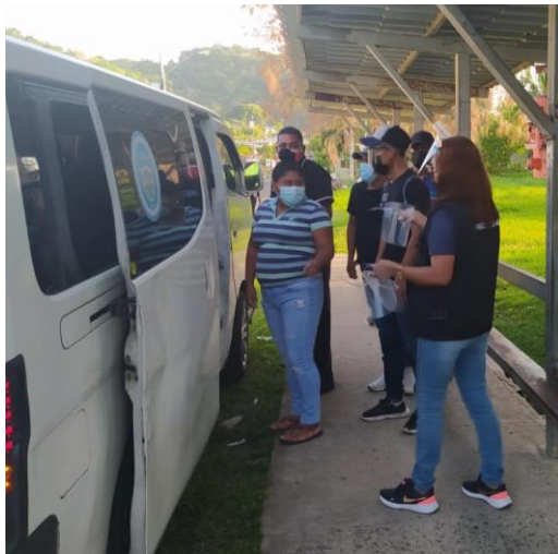
Parada de buses de rutas internas en Veracruz. 20 de mayo 2021.