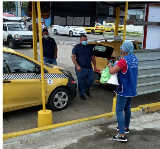
Piquera de taxis en Balmoral de Pedregal. 21 de mayo 2021.