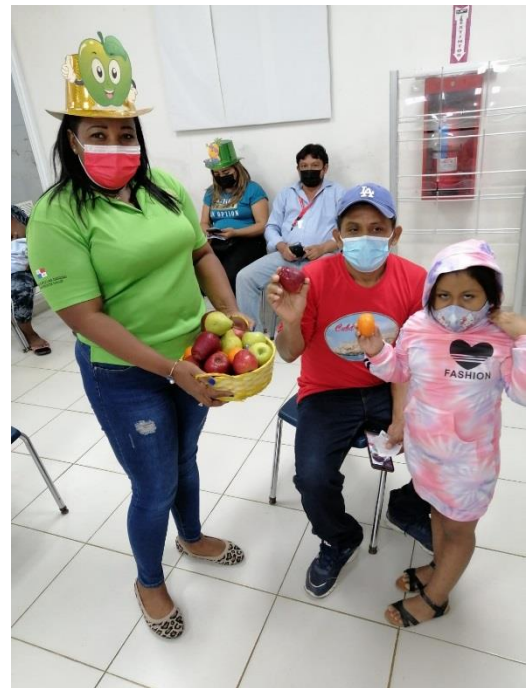
Sesión educativa y distribución de frutas en Minsa Capsi Las Garzas. 03 de mayo 2021.