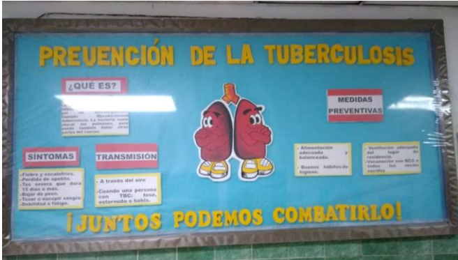
Centro de Salud de Río Abajo.