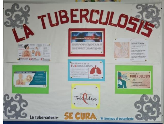
Centro de Salud Paraíso-Ancón.