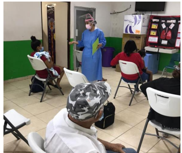
Sesión educativa en el Centro de Salud de Tocumen con el apoyo de personal de enfermería.