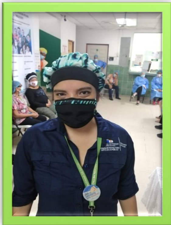
DIOSA DEL MAR