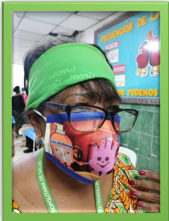
LAVADO DE MANO Y COVID-19