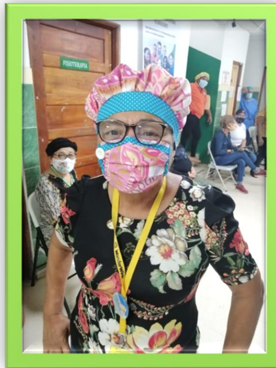
JUSTA Y NECESARIA