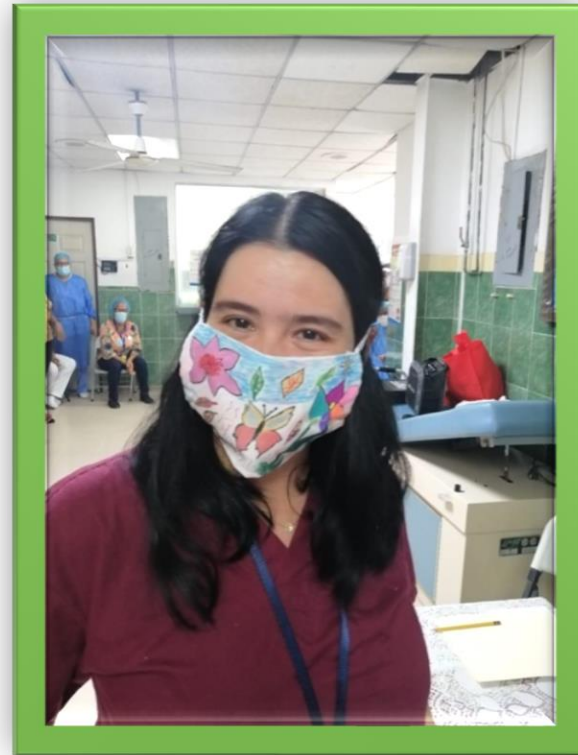
OTOÑO - PRIMAVERA