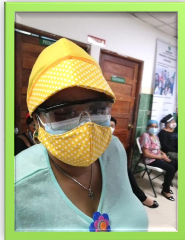
DIOSA DE ORUN