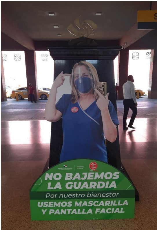
Gran Terminal Nacional de Transporte en Albrook