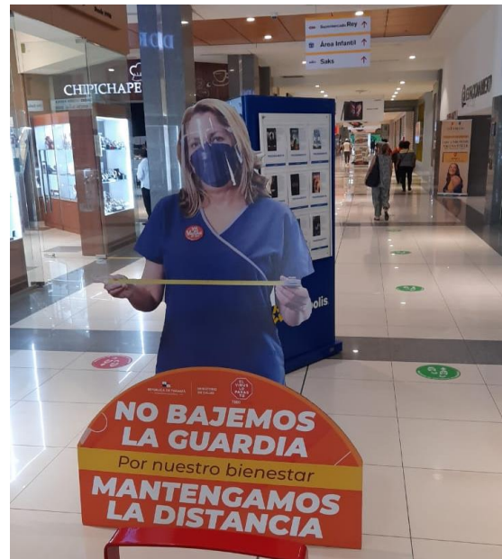
Centro Comercial Albrook Mall