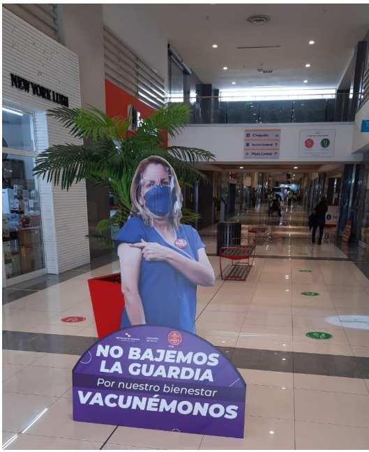
Centro Comercial Dorado Mall