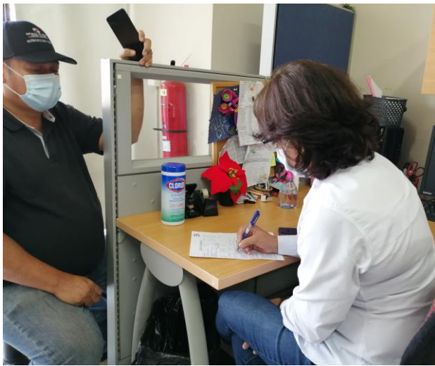
Llenado del formulario de solicitud de prueba serológica de VIH.