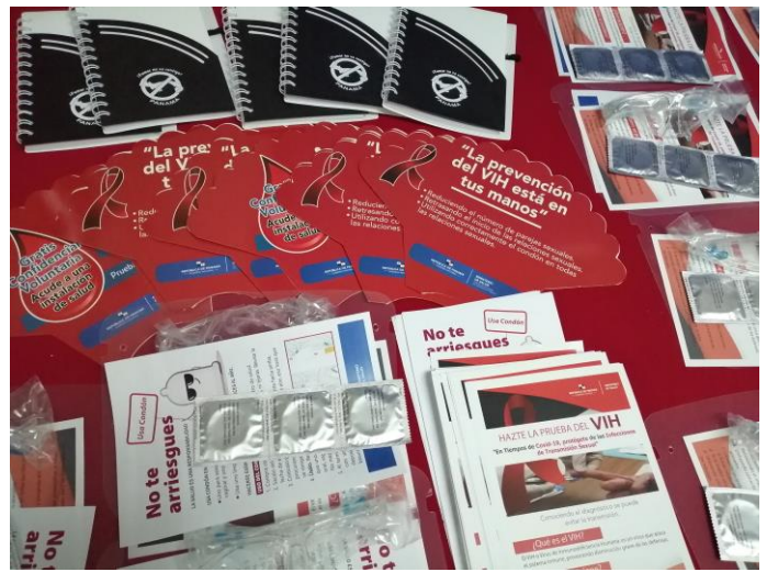
Material promocional entregado