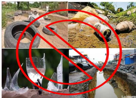
Eliminemos los criaderos

Estas medidas evita el adquirir esta y otras enfermedades.