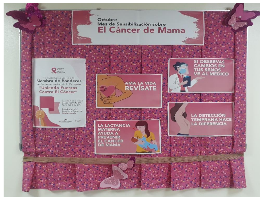
Sensibilización sobre el Cáncer de Mama.