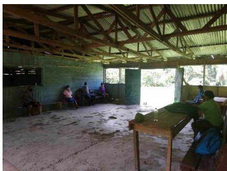
Guabo de Yorkin