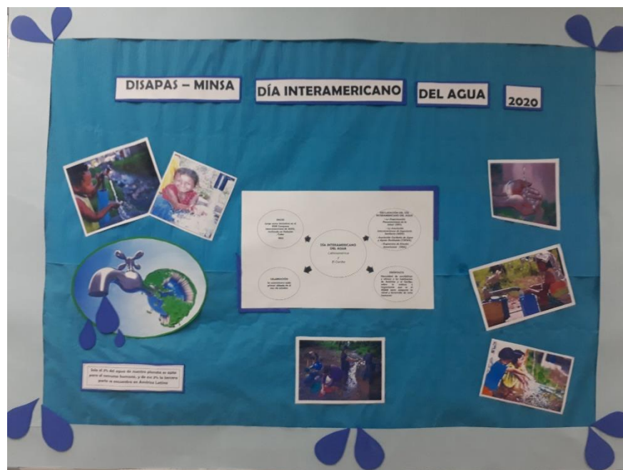
Día Interamericano del Agua 2020.