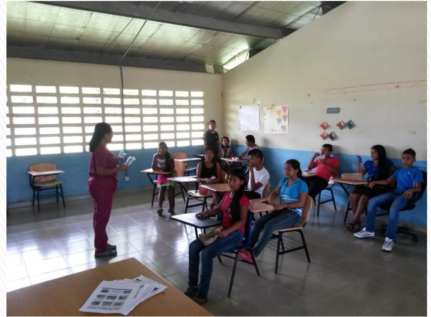
Otro grupo de adolescentes de la etnia emberà