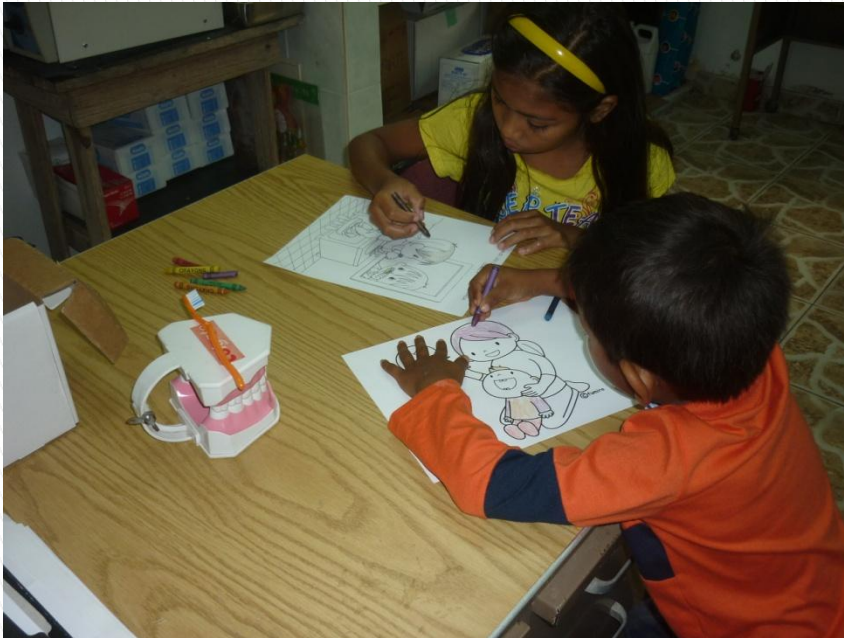
Infantes en plena actividad de colorear